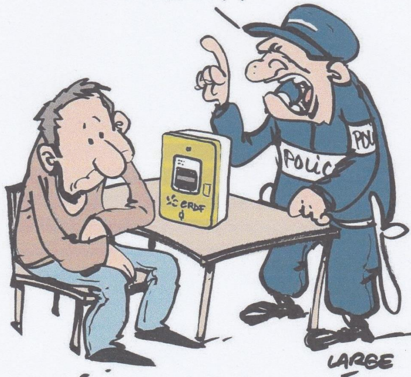
La loi permet à la police d'utiliser Linky pour surveiller un individu chez lui. DESSIN MARC LARGE

POURQUOI AVEZ-VOUS ALLUMÉ DANS LA NUIT DU 23 JUIN, DE 23H31 À 23H37 ?