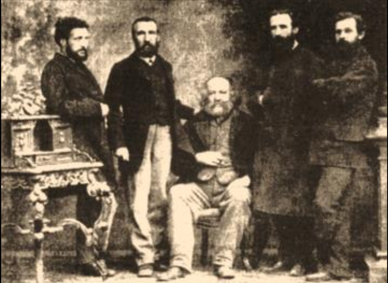
Michel Bakounine, 1869

Sur proposition de lecture par Résistance 71