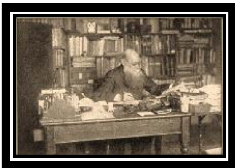
Pierre Kropotkine à sa table de travail...